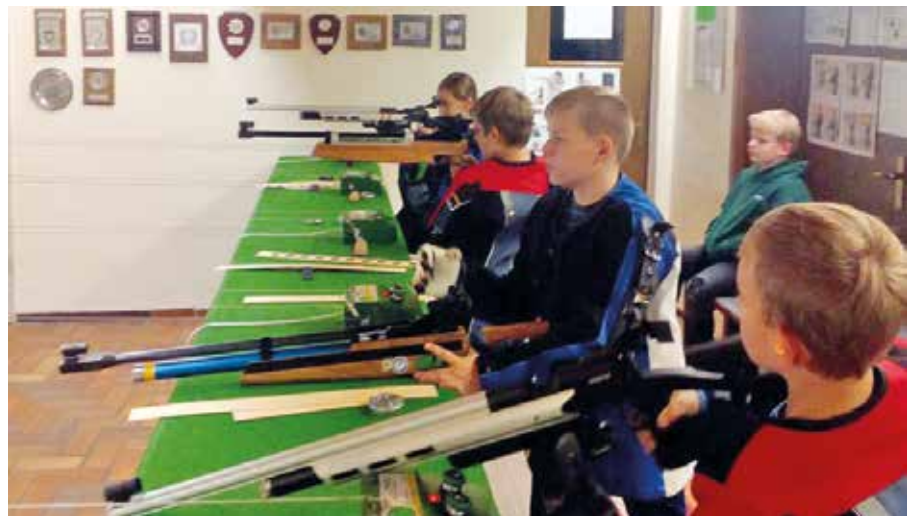
Blick ins Jugendtraining des SV Kerspenhausen, der zu den erfolgreichsten Vereinen bei der Jugend-Trophy gehörte.

„Die drei Vereine mit den meisten Teilnehmern können entscheiden, ob sie einen Trainingstag im Verein für eine Disziplin bekommen wollen, oder einen Ausbildungsgutschein – alles im Wert von 150 Euro“, so Stefan Rinke, der auf die Online-Verlosung verwies, bei der insgesamt 15 Gewinner von Gutscheinen im Wert von 30 bis 200 Euro ermittelt werden.