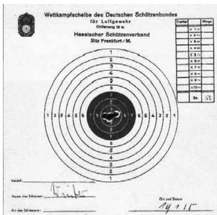
Die Luftgewehrscheibe im Jahr 1955.