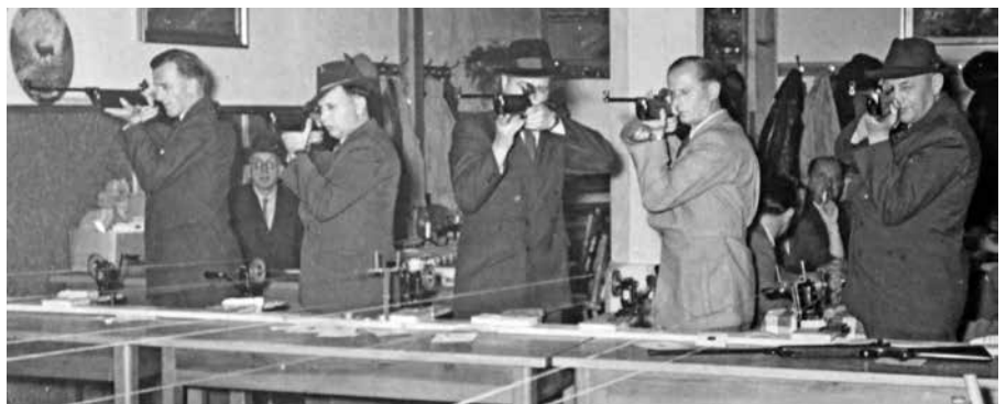
Groß-Gerauer Schützen 1953 beim Rundenwettkampf in Rüsselsheim.