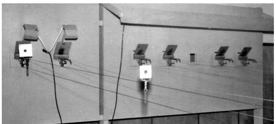
Blick auf einen Schießstand im Jahr 1954.