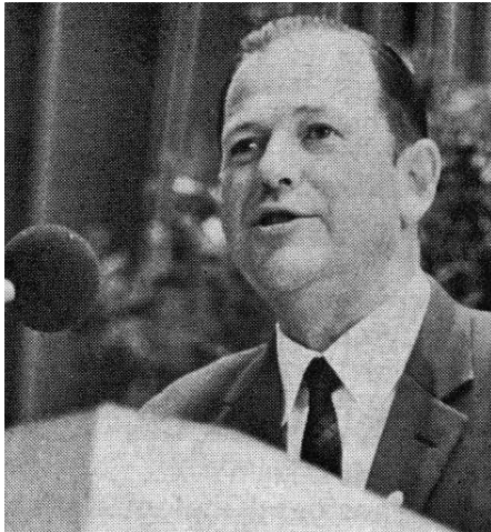
Otto Wagner – der neue Präsident des Hessischen Schützenverbandes.